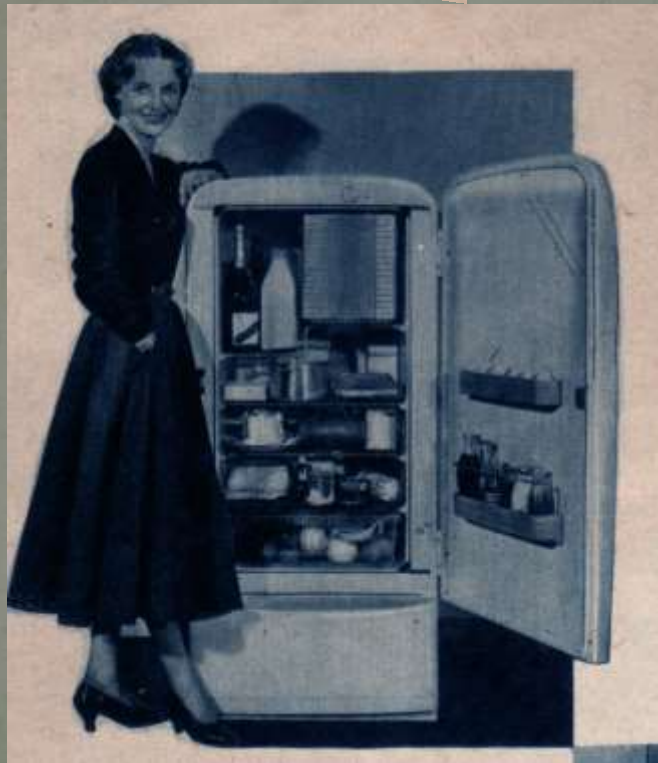
Frigorifero 175 litri

Adesso le cose sono più moderne di quelle dell'epoca.